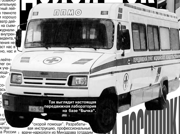
Так выглядит настоящая передвижная лаборатория на базе "Бычка".

"скорой помощи". Разработав инструкцию, профессиональные врачи-наркологи из Минздрава (отдадим им должное!) сообразили, что выявление состояния опьянения — дело тонкое, а потому позволили практикующим врачам-наркологам проводить освидетельствование если уж не в учреждении здравоохранения, то хотя бы в специально оборудованных для этой цели передвижных лабораториях!